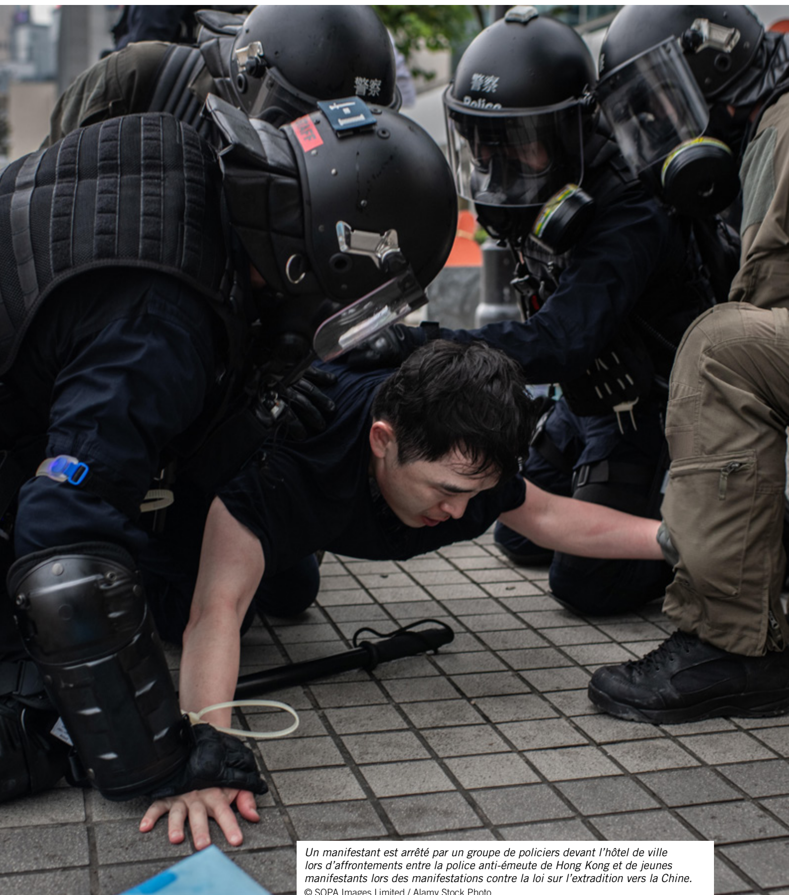
Un manifestant est arrêté par un groupe de policiers devant l'hôtel de ville lors d'affrontements entre la police anti-émeute de Hong Kong et de jeunes manifestants lors des manifestations contre la loi sur l'extradition vers la Chine.