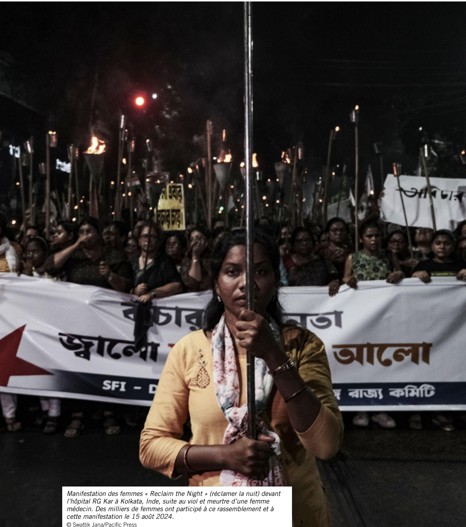
Manifestation des femmes « Reclaim the Night » (réclamer la nuit) devant l'hôpital RG Kar à Kolkata, Inde, suite au viol et meurtre d'une femme médecin. Des milliers de femmes ont participé à ce rassemblement et à cette manifestation le 15 août 2024.