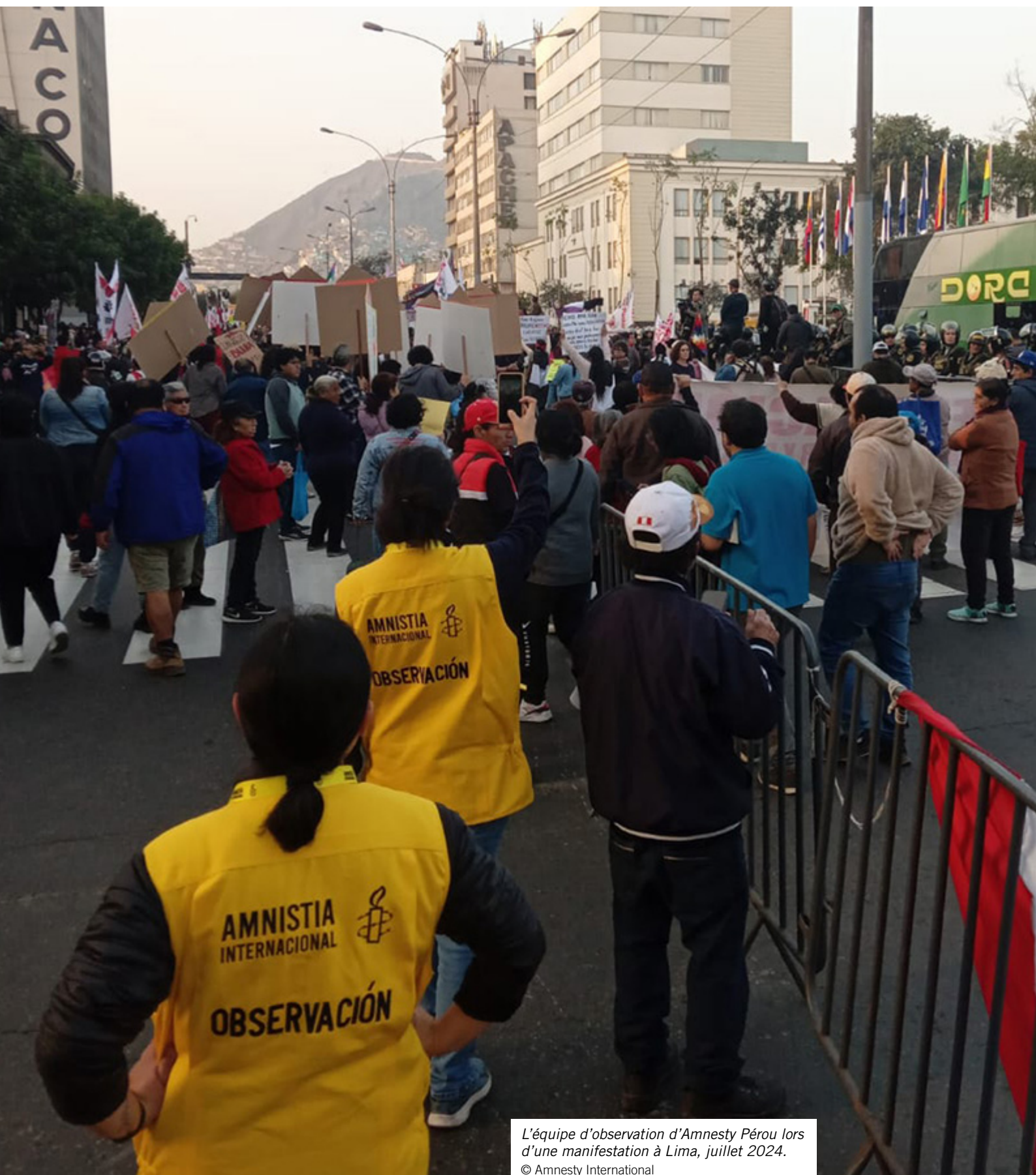
L'équipe d'observation d'Amnesty Pérou lors d'une manifestation à Lima, juillet 2024.