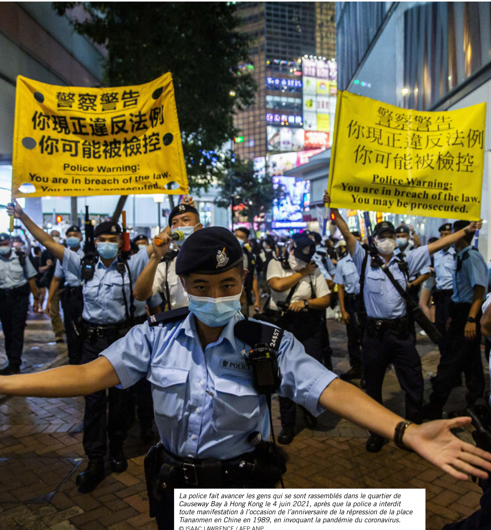
La police fait avancer les gens qui se sont rassemblés dans le quartier de Causeway Bay à Hong Kong le 4 juin 2021, après que la police a interdit toute manifestation à l'occasion de l'anniversaire de la répression de la place Tiananmen en Chine en 1989, en invoquant la pandémie du coronavirus.