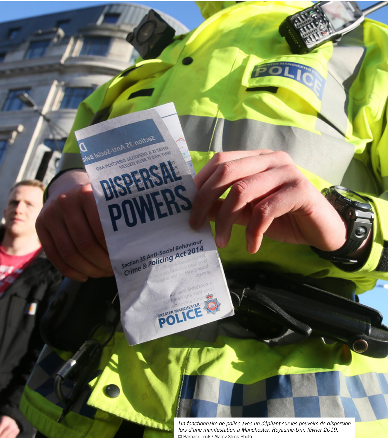
Un fonctionnaire de police avec un dépliant sur les pouvoirs de dispersion lors d'une manifestation à Manchester, Royaume-Uni, février 2019.