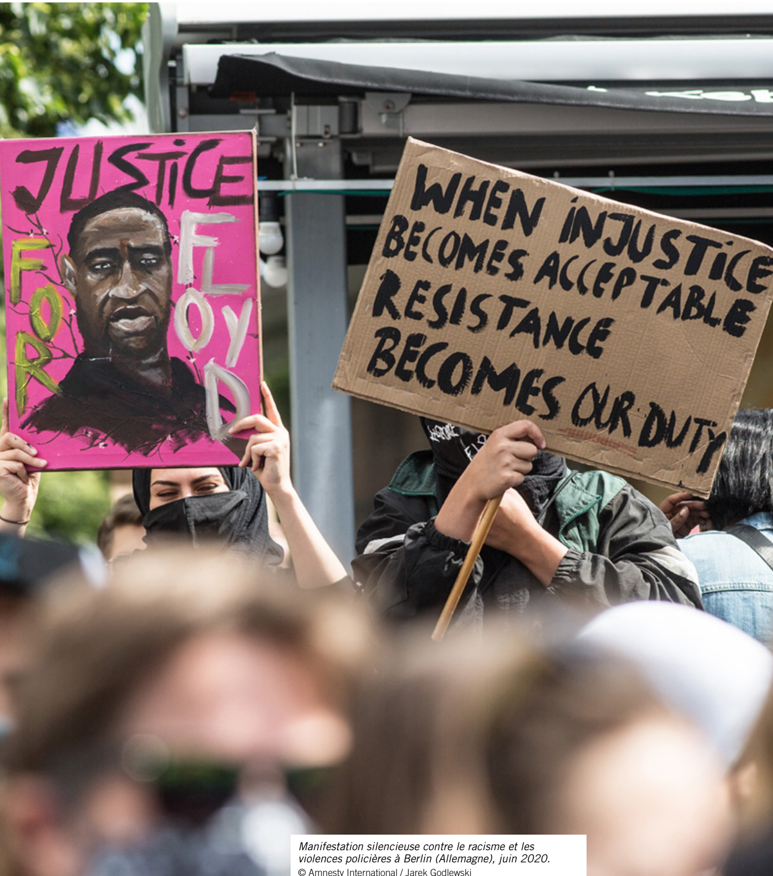
Manifestation silencieuse contre le racisme et les violences policières à Berlin (Allemagne), juin 2020.