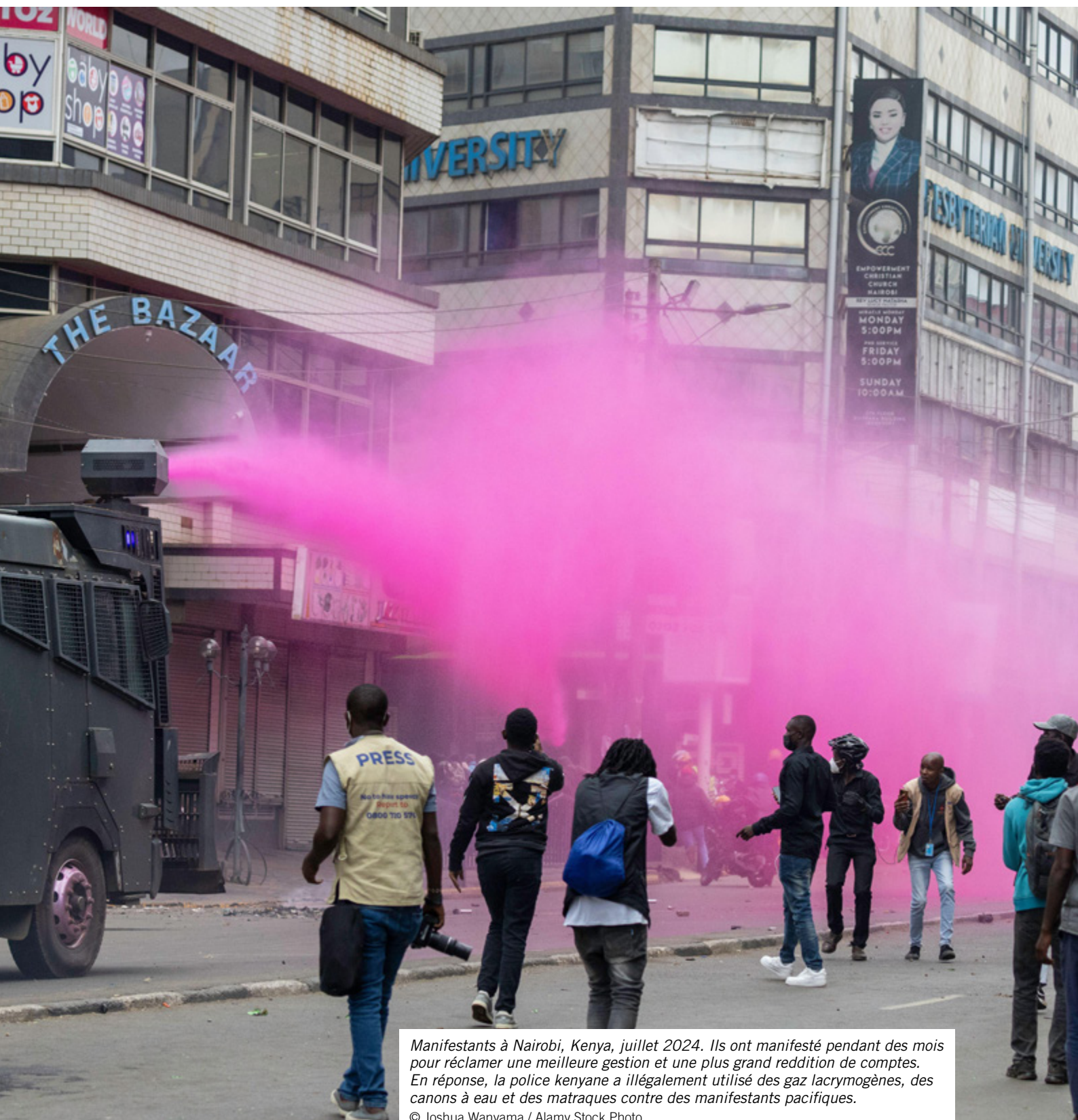
Manifestants à Nairobi, Kenya, juillet 2024. Ils ont manifesté pendant des mois pour réclamer une meilleure gestion et une plus grande reddition de comptes. En réponse, la police kenyane a illégalement utilisé des gaz lacrymogènes, des canons à eau et des matraques contre des manifestants pacifiques.