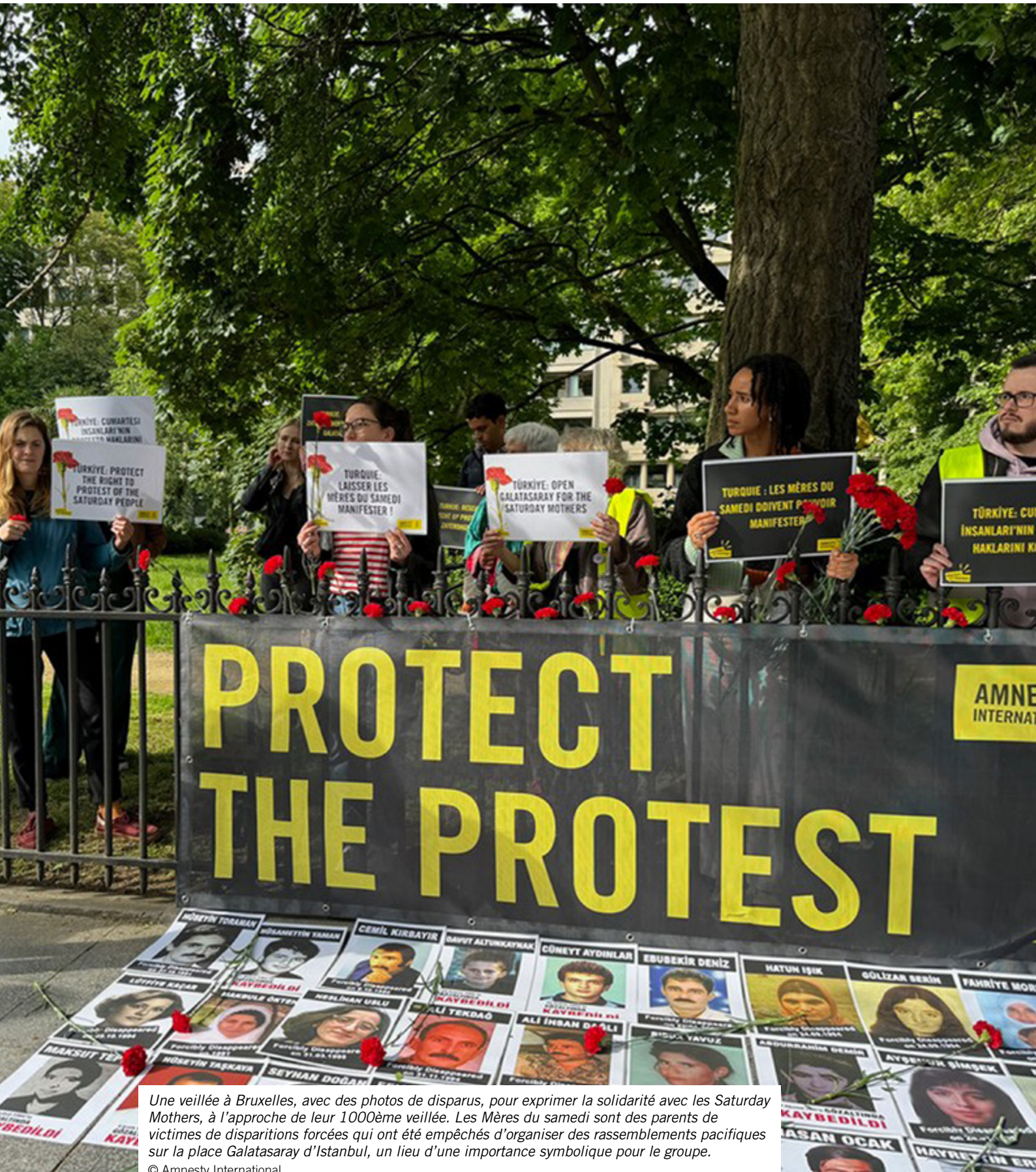
Une veillée à Bruxelles, avec des photos de disparus, pour exprimer la solidarité avec les Saturday Mothers, à l'approche de leur 1000ème veillée. Les Mères du samedi sont des parents de victimes de disparitions forcées qui ont été empêchés d'organiser des rassemblements pacifiques sur la place Galatasaray d'Istanbul, un lieu d'une importance symbolique pour le groupe.