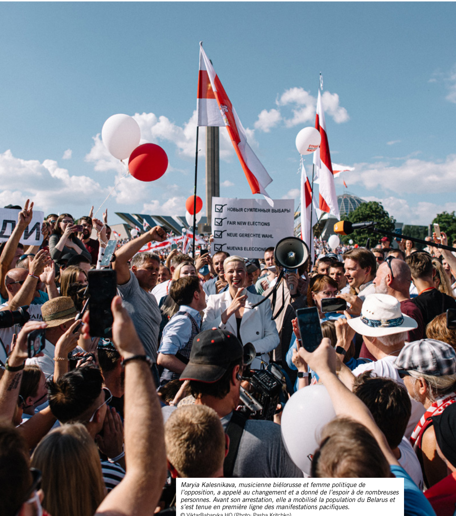
Maryia Kalesnikava, musicienne biélorusse et femme politique de l'opposition, a appelé au changement et a donné de l'espoir à de nombreuses personnes. Avant son arrestation, elle a mobilisé la population du Belarus et s'est tenue en première ligne des manifestations pacifiques.