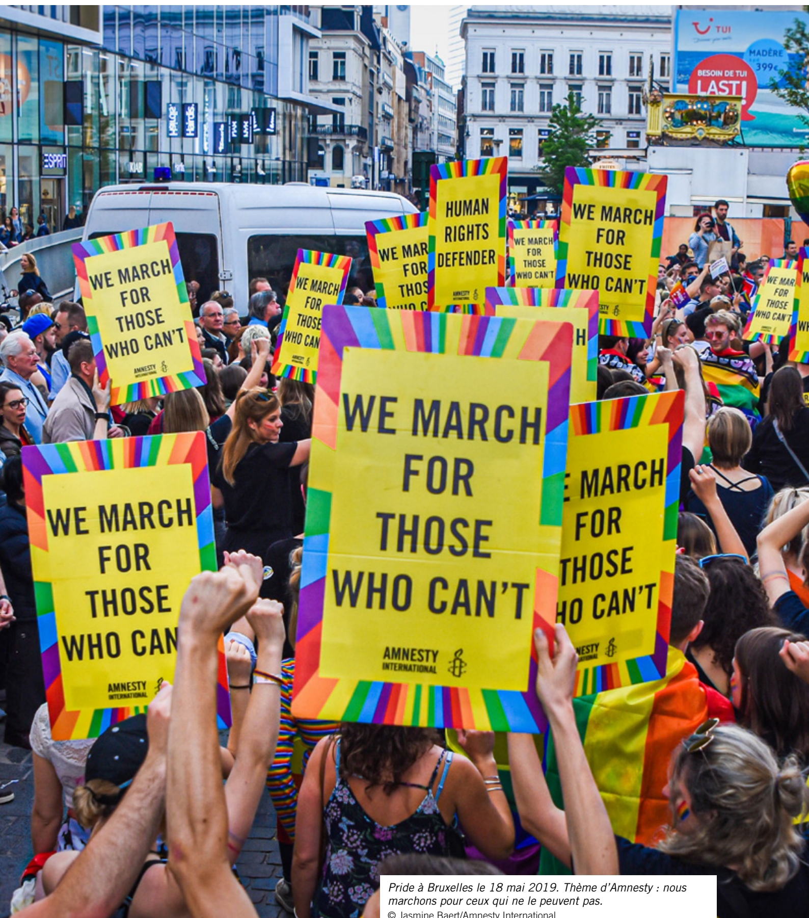
Pride à Bruxelles le 18 mai 2019. Thème d'Amnesty : nous marchons pour ceux qui ne le peuvent pas.