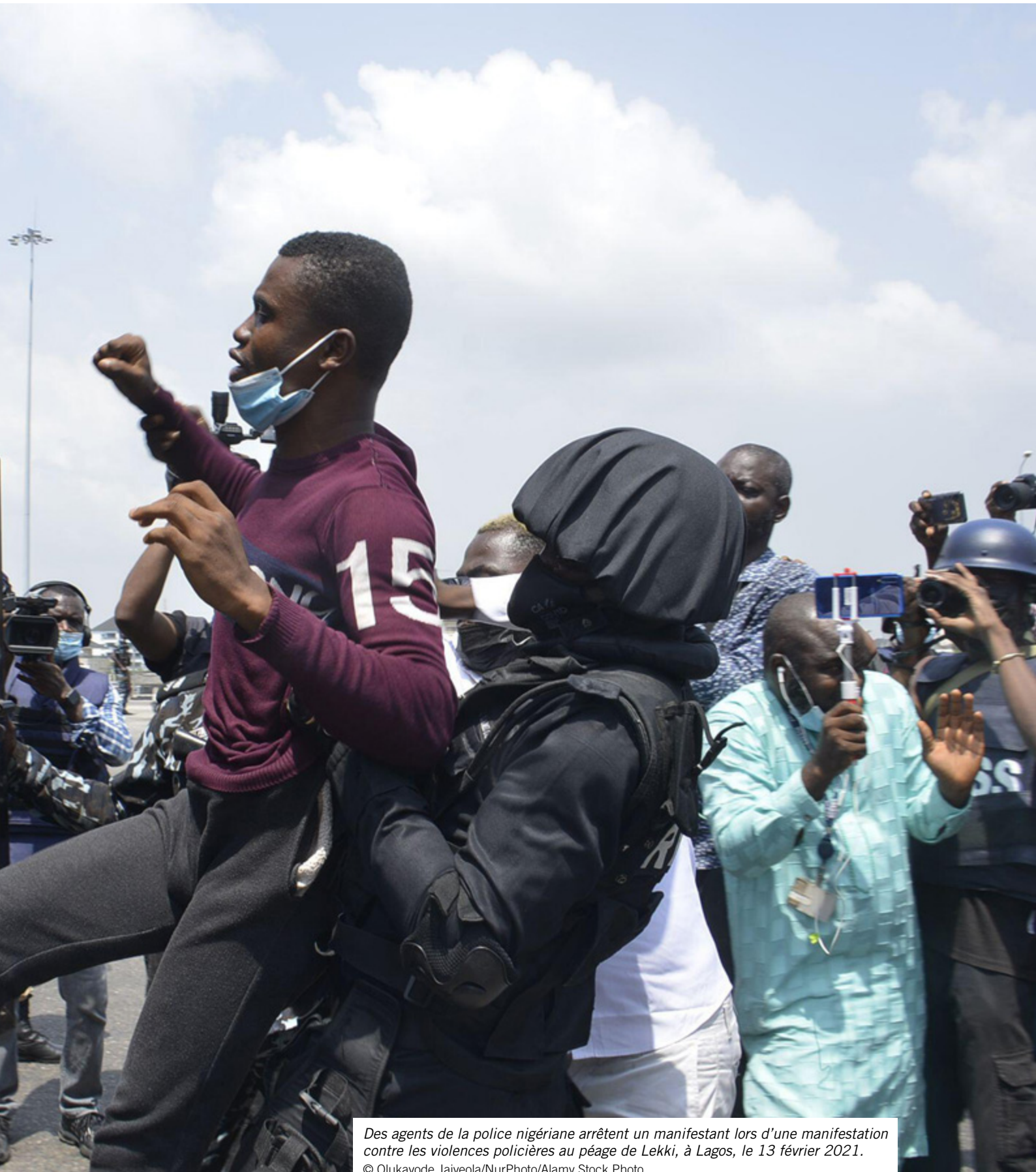
Des agents de la police nigériane arrêtent un manifestant lors d'une manifestation contre les violences policières au péage de Lekki, à Lagos, le 13 février 2021.