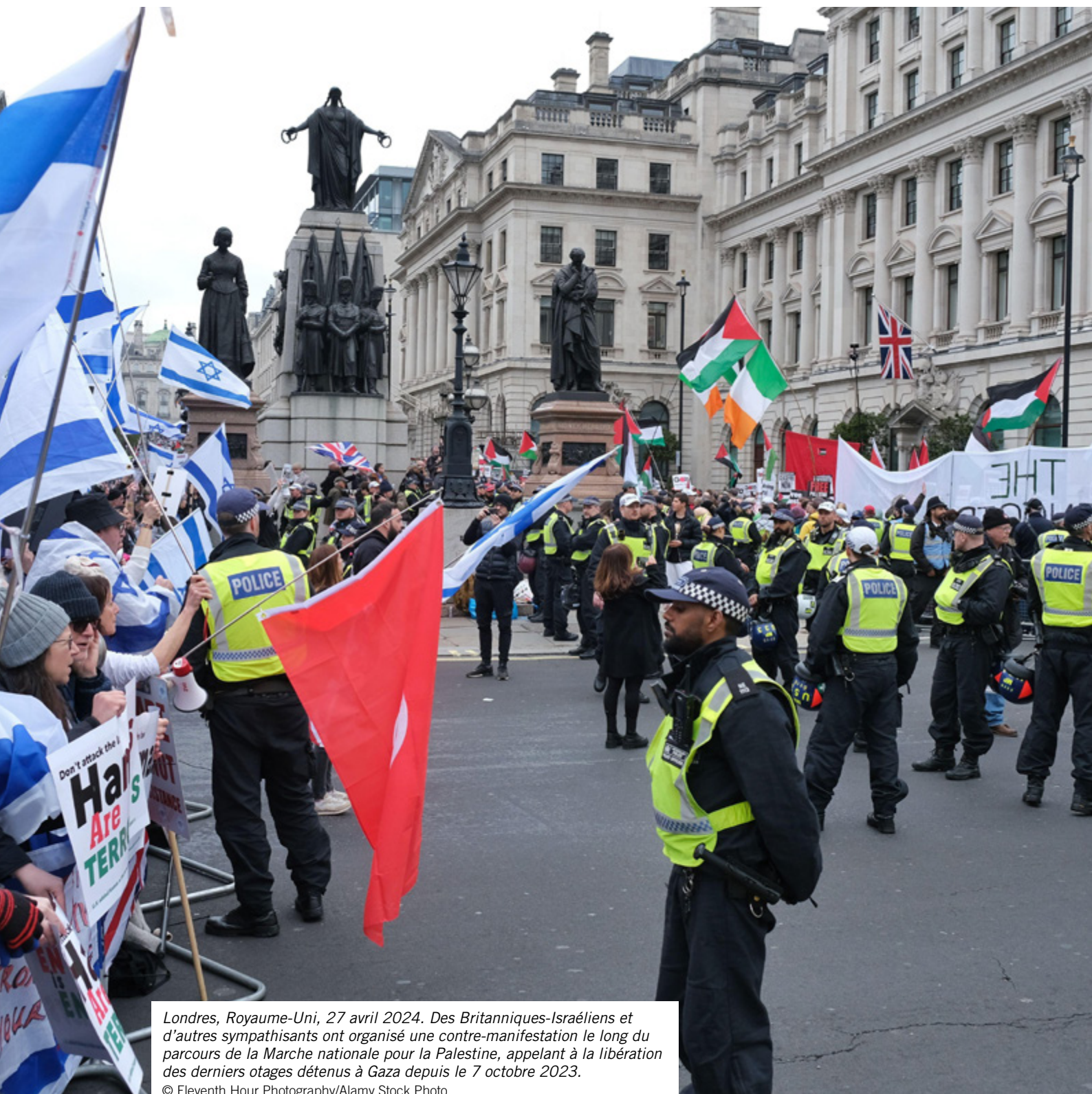
Londres, Royaume-Uni, 27 avril 2024. Des Britanniques-Israéliens et d'autres sympathisants ont organisé une contre-manifestation le long du parcours de la Marche nationale pour la Palestine, appelant à la libération des derniers otages détenus à Gaza depuis le 7 octobre 2023.