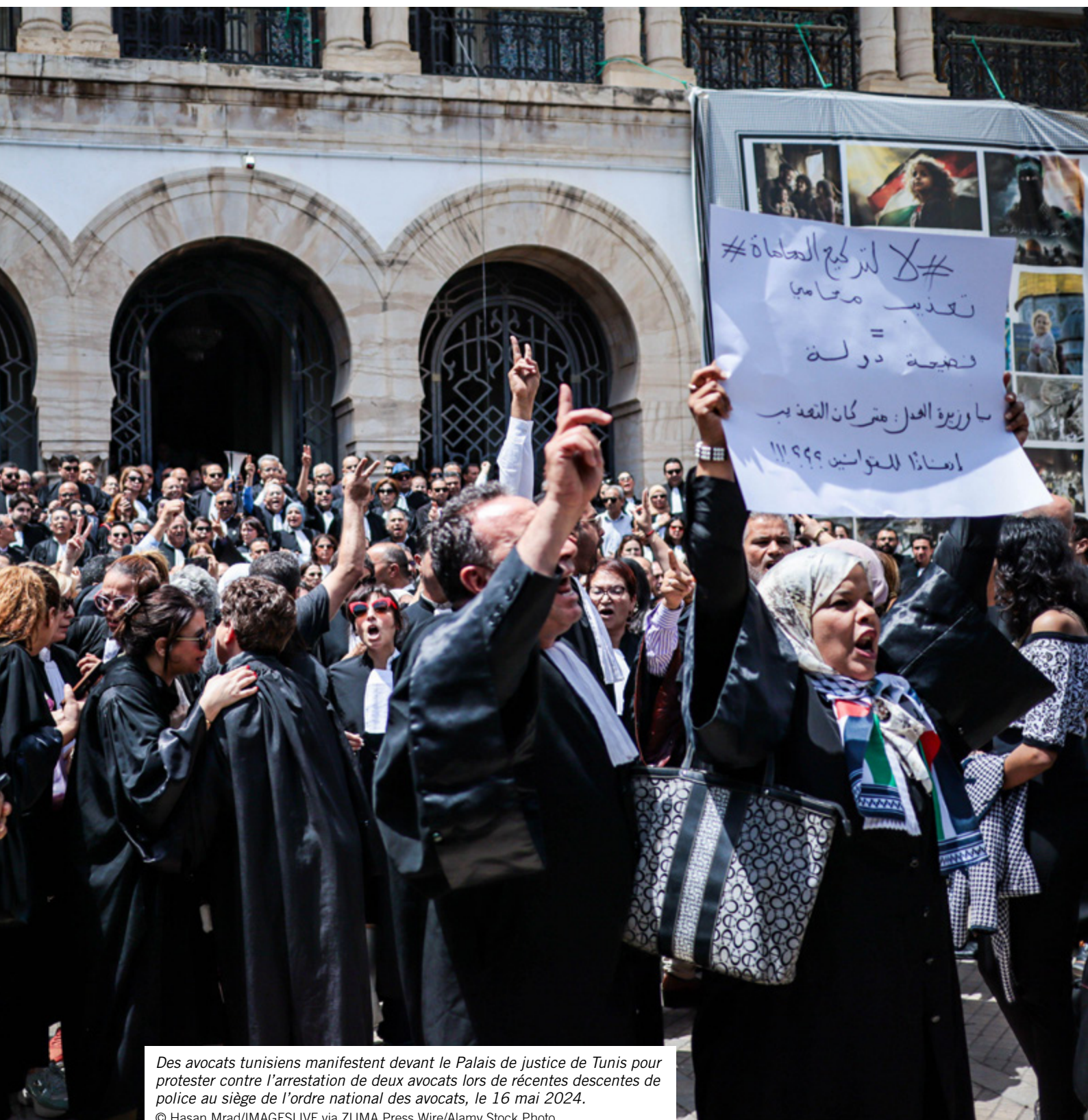
Des avocats tunisiens manifestent devant le Palais de justice de Tunis pour protester contre l'arrestation de deux avocats lors de récentes descentes de police au siège de l'ordre national des avocats, le 16 mai 2024.