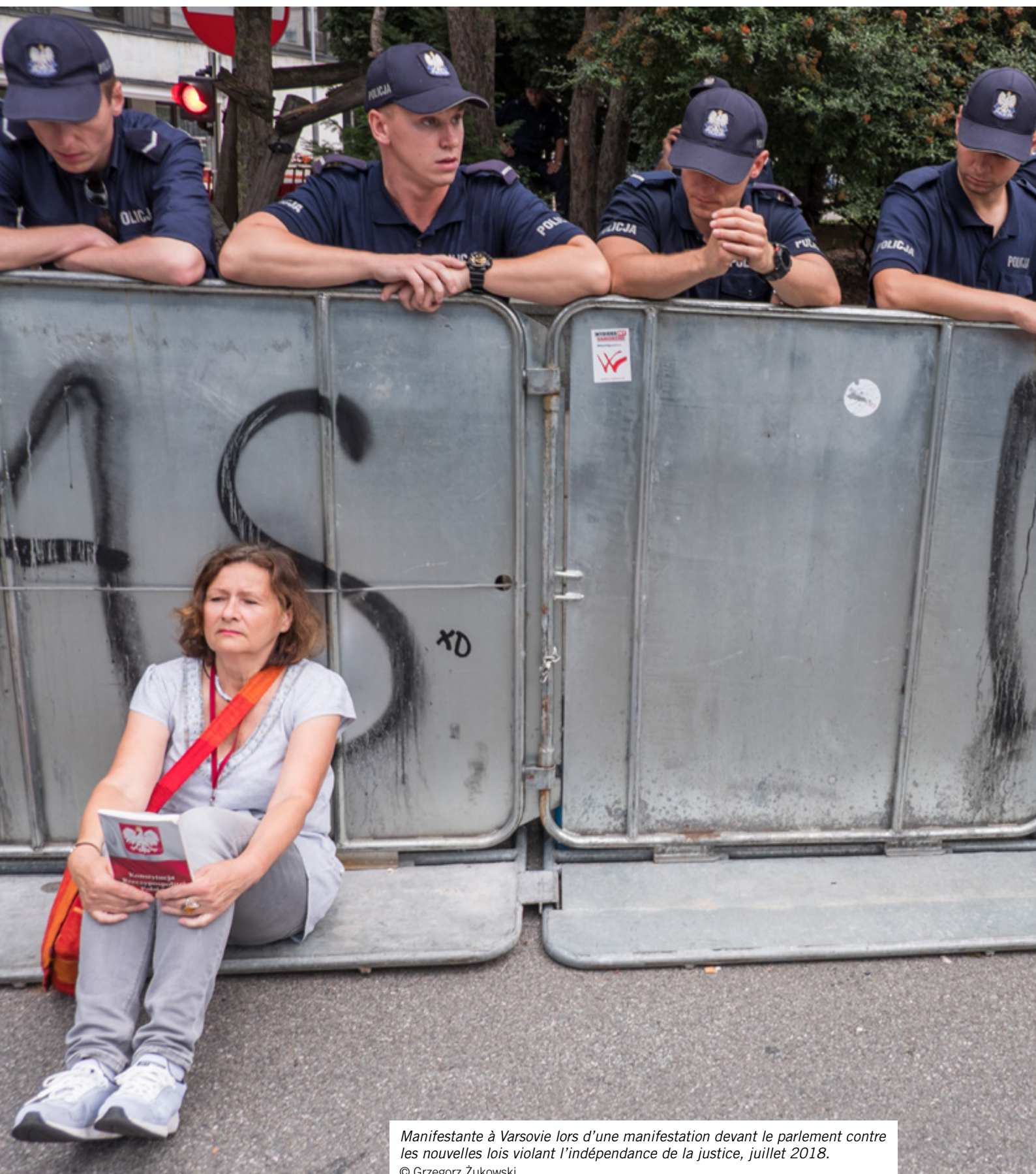
Manifestante à Varsovie lors d'une manifestation devant le parlement contre les nouvelles lois violant l'indépendance de la justice, juillet 2018.