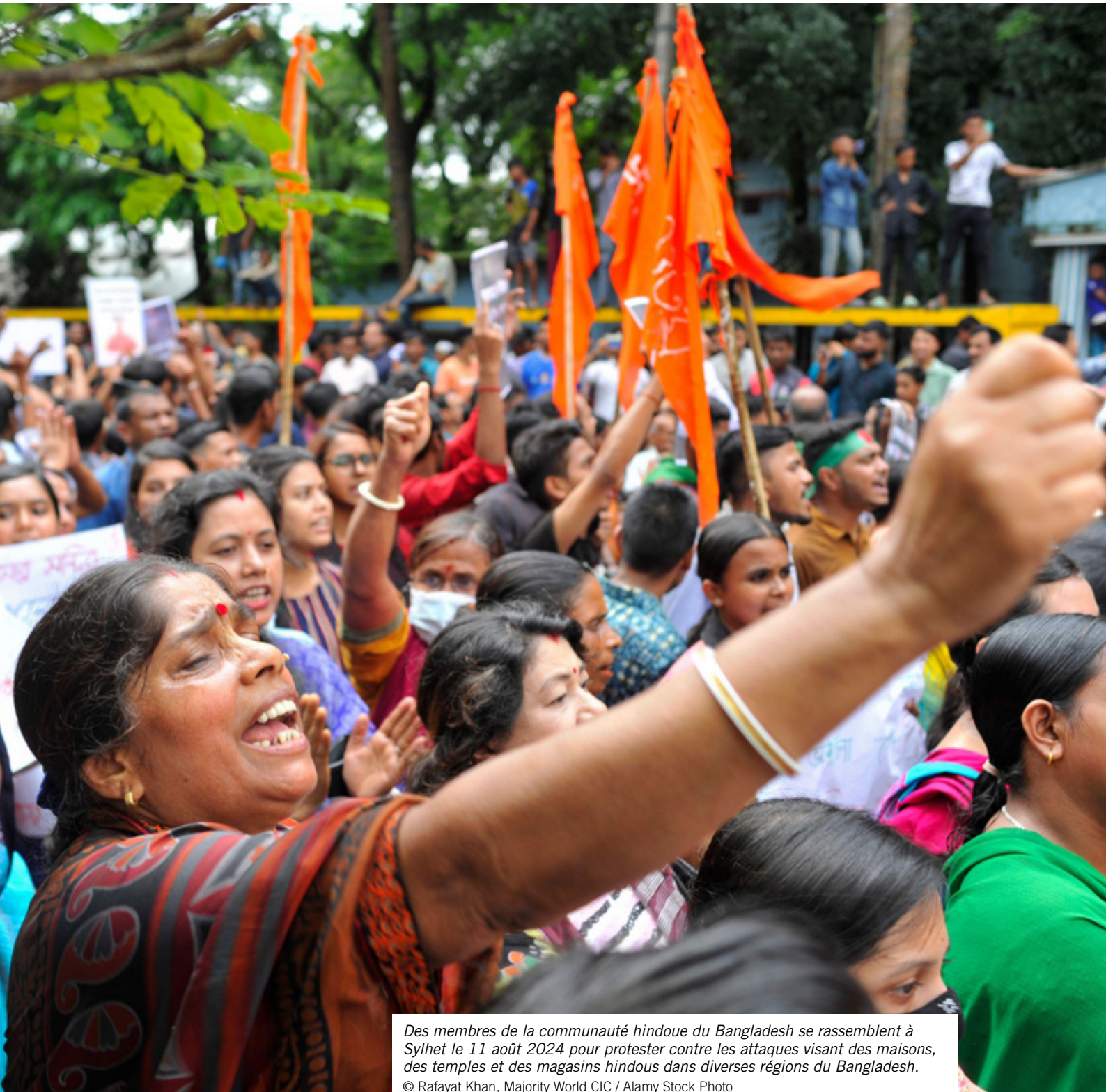
Des membres de la communauté hindoue du Bangladesh se rassemblent à Sylhet le 11 août 2024 pour protester contre les attaques visant des maisons, des temples et des magasins hindous dans diverses régions du Bangladesh.