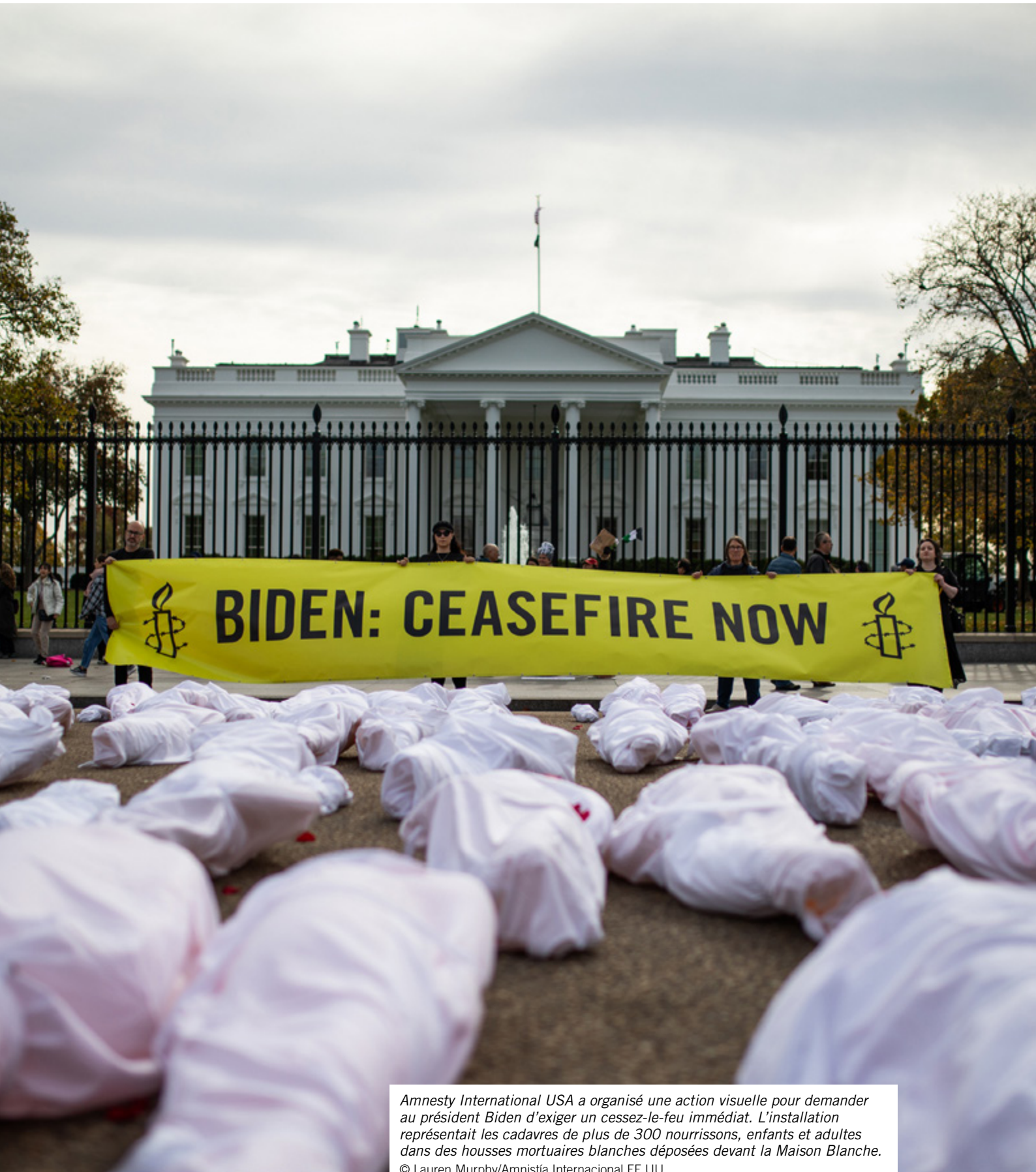
Amnesty International USA a organisé une action visuelle pour demander au président Biden d'exiger un cessez-le-feu immédiat. L'installation représentait les cadavres de plus de 300 nourrissons, enfants et adultes dans des housses mortuaires blanches déposées devant la Maison Blanche.