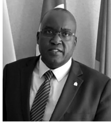
السيد/ جيديون كيميلو رئيس المكتب الإقليمي للإنتربول في نيروبي وأمانة منظمة تعاون رؤساء شرطة شرق إفريقيا

وبمقدور المعايير المشتركة أن توفر دليلاً واضحاً لكيفية تحسين التمثيل الجنساني داخل الشرطة من خلال التوظيف والتدريب والترقية. وإذا طبقت دول المنطقة المعايير المشتركة، فسيكون لدينا مع مرور الوقت تمثيلاً متساوياً على أساس النوع الجنسي على كافة مستويات الخدمات الشرطية. وسيسهم التمثيل المناسب القائم على النوع الجنسي في كافة مستويات العمل الشرطي وبشكل كبير باتجاه العمل الشرطي المتوافق مع الديمقراطية وحقوق الإنسان.